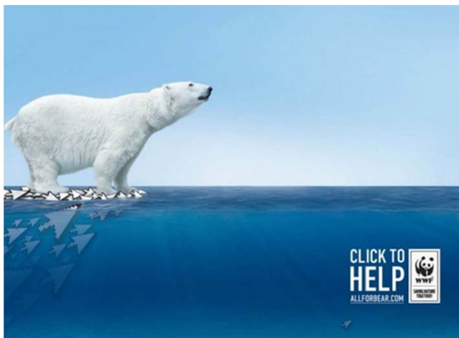
Pieza: Click to help. Cliente: WWF International. Agencia: BBDO Group Russia. País: Rusia