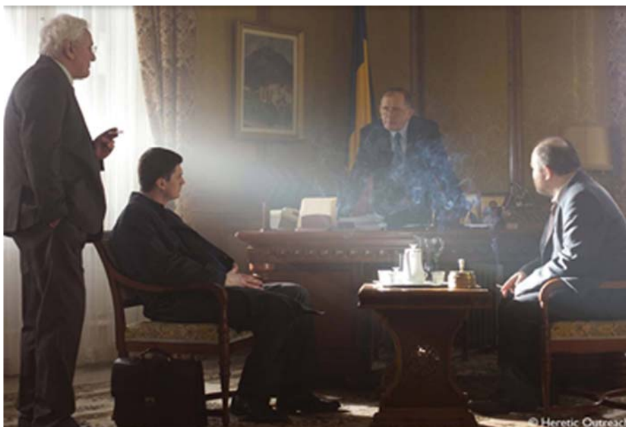
'De ce eu?' ('Why Me?'), de Tudor Giurgiu (Rumania/Bulgaria/Hungría).